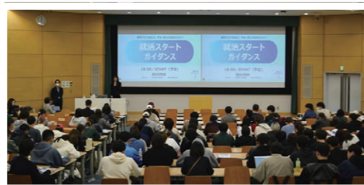
就活スタートガイダンス

冬休みという、まとまった期間を最大限有効活用するために、今から計画的にしっかり準備をしましょう。すでに早い段階から着手してきた方もいるかもしれませんが、あらためてここで、次に挙げる項目を整理しておきましょう。